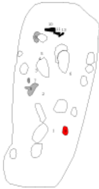
Grav 120 605 och ett av spånen